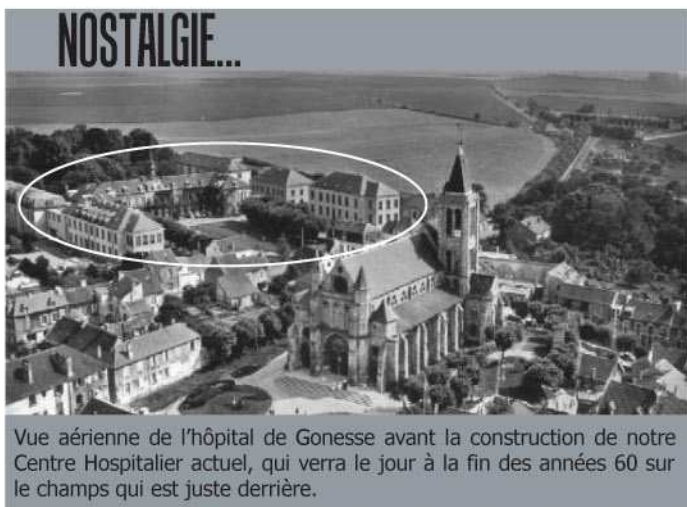
NOSTALGIE... Vue aérienne de l'hôpital de Gonesse avant la construction de notre Centre Hospitalier actuel, qui verra le jour à la fin des années 60 sur le champs qui est juste derrière.

Adresse de l'ARS Île-de-France : ARS - Cellule de veille, d'alerte et de gestion sanitaire 35 Rue de la gare - Millénaire 2 75935 Paris Cedex 19