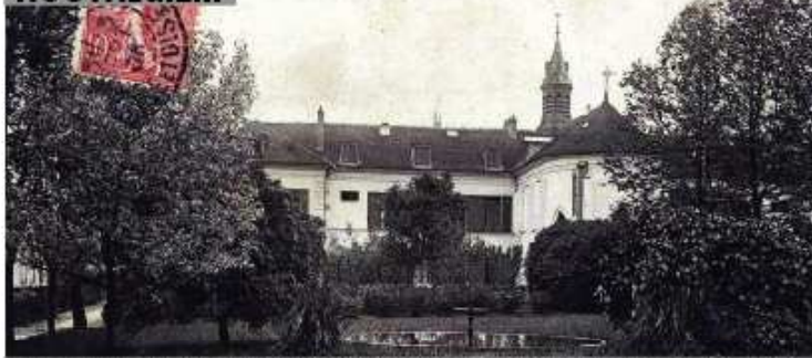
La chapelle du bâtiment P. de Theilley et les jardins avec bassin rond en 1906

GONESSE - HOTEL-DIEU - CHAPELLE ET JARDINS