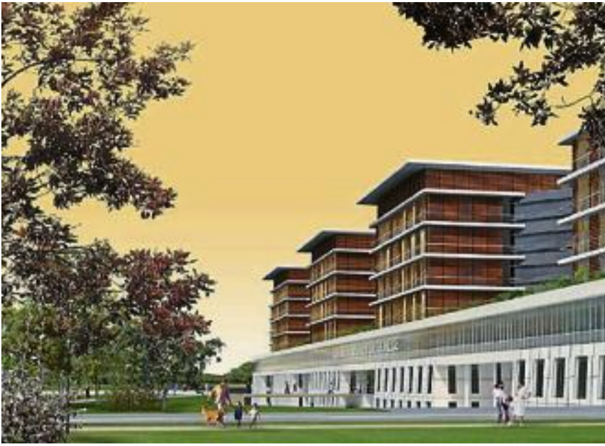
L'HÔPITAL accueillera les premiers patients en juin 2016.