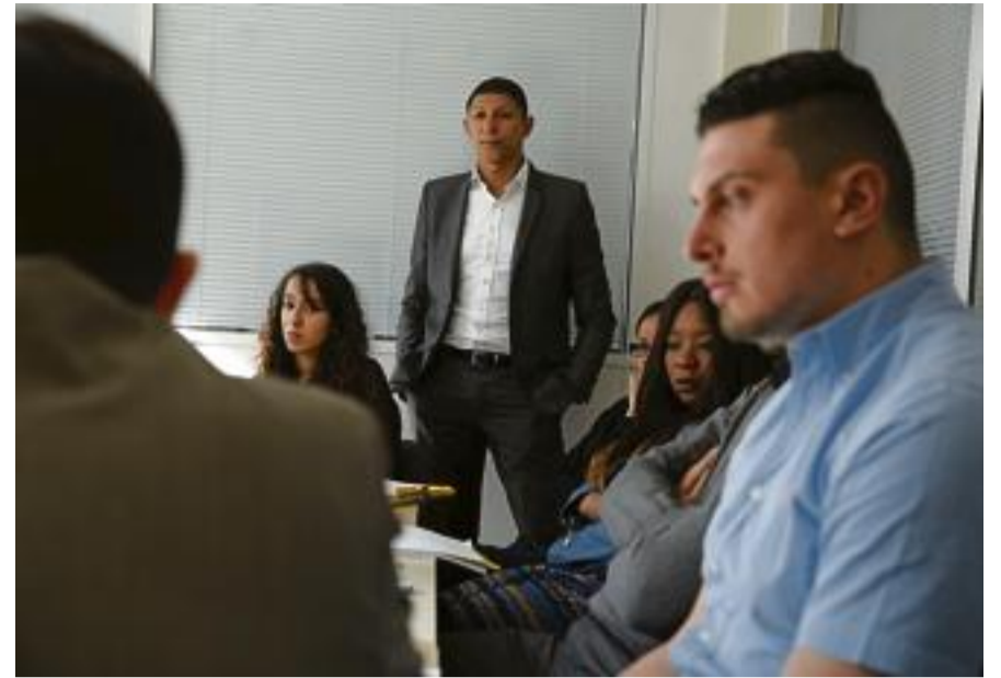
LE CABINET de recrutement veut sensibiliser les entreprises au recrutement diversifié.