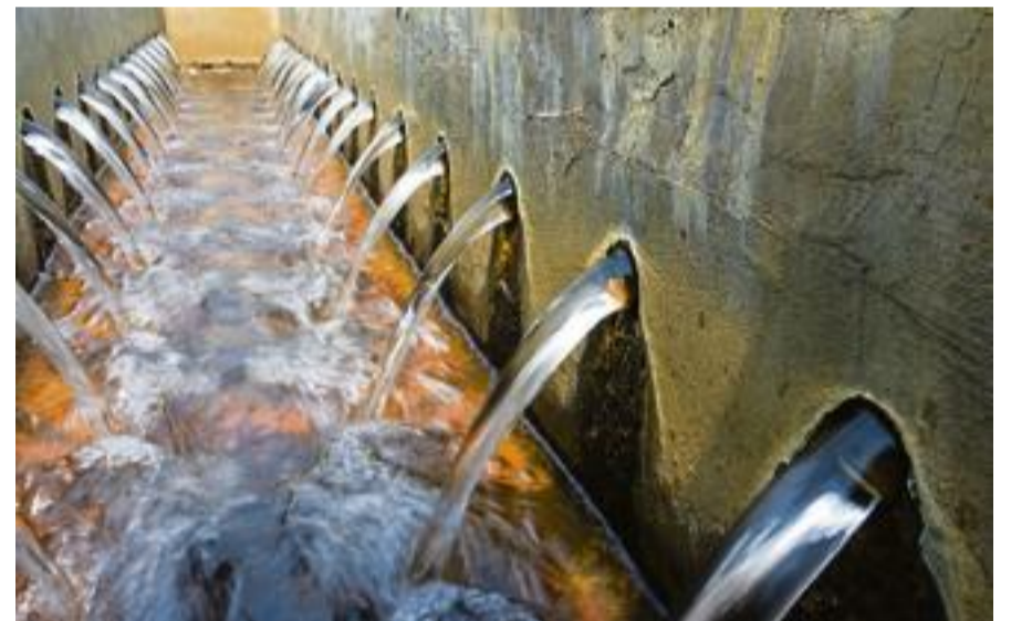
TOUTE CONSTRUCTION ou extension immobilière est désormais interdite dans un rayon de 700 mètres autour de l'usine de traitement des eaux.

Spécialisée dans le placement des jeunes diplômés issus des quartiers populaires, le cabinet Mozaïk RH fait part de son intention d'ouvrir une nouvelle antenne dans le Val d'Oise. Un territoire considéré comme « une zone de développement incontournable du Grand Paris », rappelle cette association loi de 1901 qui a fait de la promotion de la diversité et de l'égalité des chances le cœur de son action. Mozaïk RH envisage de dédier trois recruteurs au territoire et annonce la possibilité de « réaliser le placement de 100 candidats en 2016 ». — S. F.