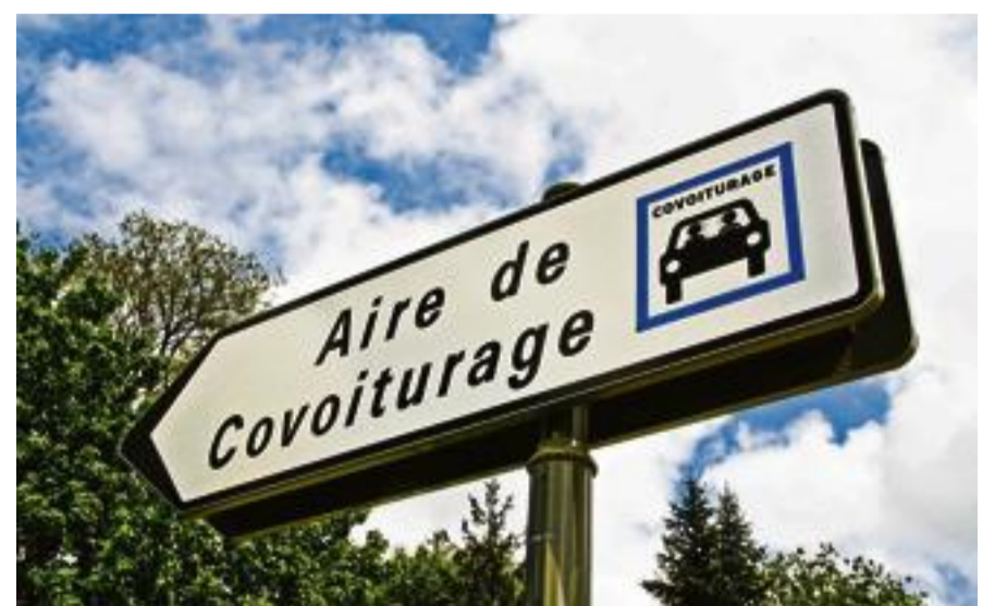
DES BORNES interactives installées le long des routes signaleront les piétons en attente de covoiturage aux automobilistes.

Le premier semestre de l'hôpital sera capturé dans une série de photos et de portraits réalisés par le photjournaliste Samuel Bollendorff. Ce dernier avait déjà réalisé des reportages au sein des hôpitaux entre 1998 et 2004. bit.ly/1NmNL90