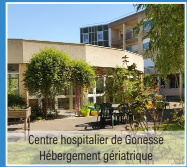
Centre hospitalier de Gonesse Hébergement gériatrique