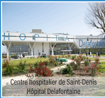
Centre hospitalier de Saint-Denis Hôpital Delafontaine