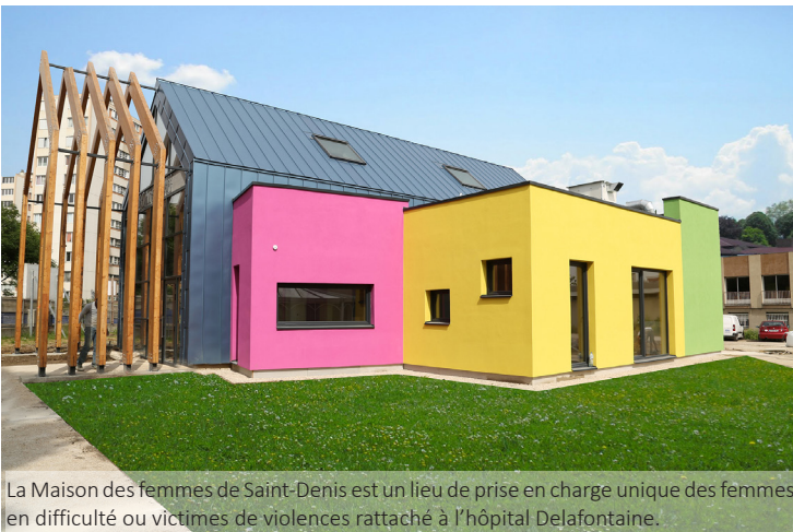
La Maison des femmes de Saint-Denis est un lieu de prise en charge unique des femmes en difficulté ou victimes de violences rattaché à l'hôpital Delafontaine.