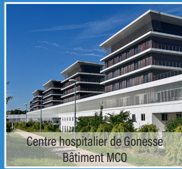
Centre hospitalier de Gonesse Bâtiment MCO