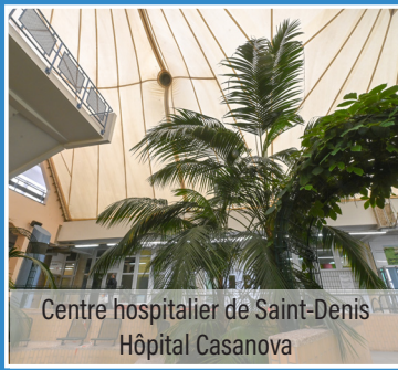
Centre hospitalier de Saint-Denis Hôpital Casanova