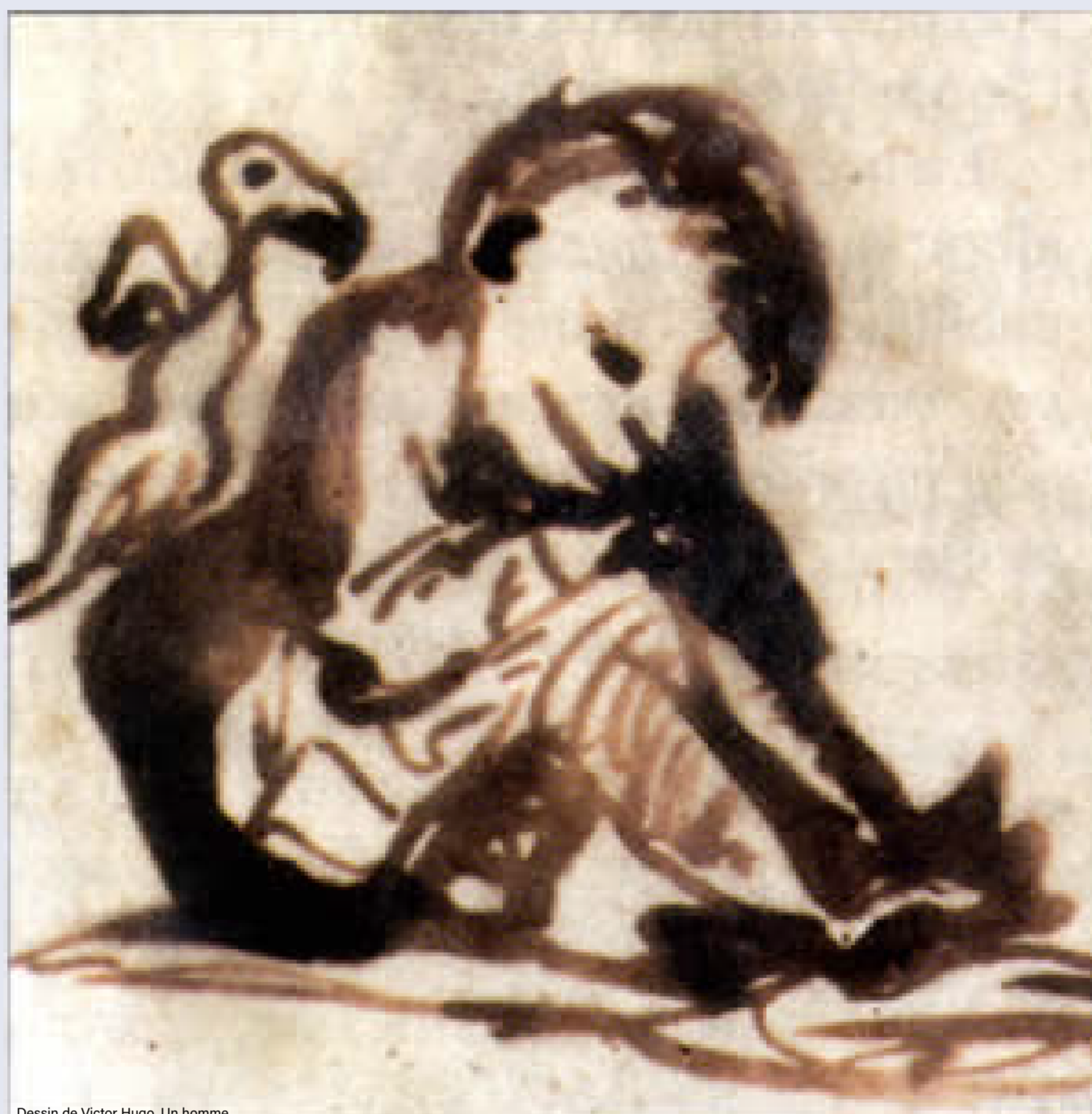
Dessin de Victor Hugo, Un homme