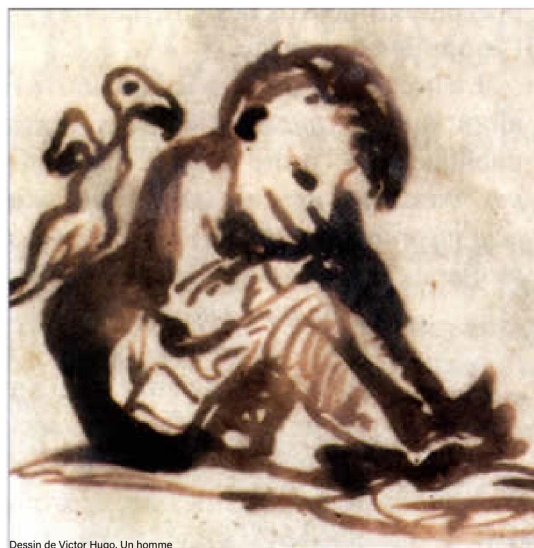
Dessin de Victor Hugo, Un homme

Psychologue en pédopsychiatrie puis en protection de l'enfance, elle a développé une clinique des dysfonctionnements de la relation parents/bébés, enfants, adolescents/société, une clinique des marges adaptée aux effets psychiques des violences sociales et historiques. Elle est l'auteure de nombreux articles scientifiques et d'un ouvrage intitulé Révoltes postcoloniales au cœur de l'hexagone. Voix d'adolescents, publié aux PUF en 2013.